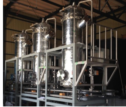
宽 4,900mm × 纵深 1,200mm × 高 3,800mm