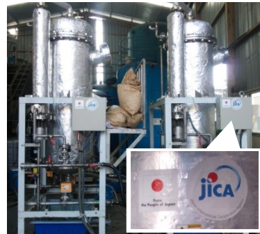
在万隆市纤维工厂进行实证试验的状况

印度尼西亚共和国 为了促进再生水的利用和工业废水的处理， 实施了自动再生式活性炭废水处理技术的普及实证事业